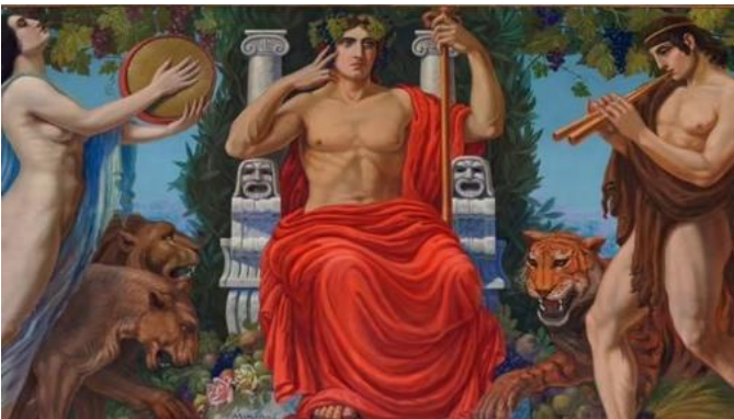
Dionysus enthroned between a bacchant and a faun , Antonio Maria Morera 1924

La voix comme extension du corps balbutie, hurle et chante les voyages, les errances, les hybridations, les syncrétismes.