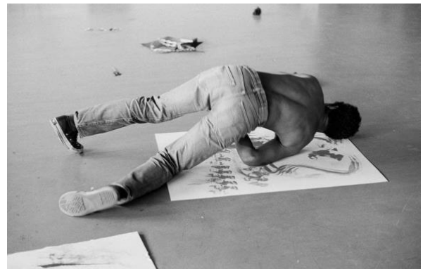
David Hammons making a body print, Slauson Avenue studio, Los Angeles