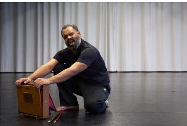
résidence recherche CND Pantin, Janvier 2026

Cambrier pour lancer un projectile, pour en éviter un, pour témoigner sa résistance, son opposition. Mais cambrier, c'est aussi regarder le ciel et nous pouvons le faire de n'importe où. Se mettre en lien avec un monde qui nous dépasse, rendre à l'horizon toute son immensité. Il y a dans cette action plusieurs visages, comme ce qui représente Dionysos.