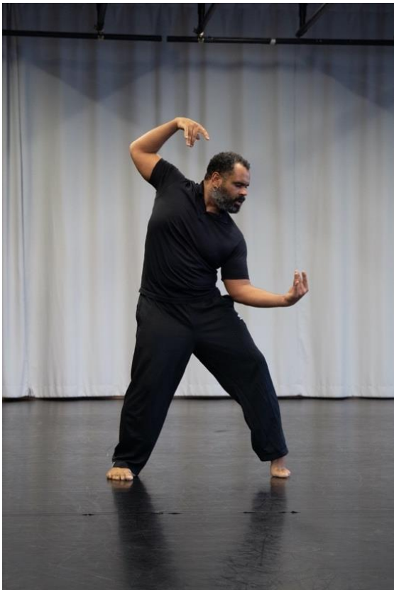
résidence recherche CND Pantin, Janvier 2026