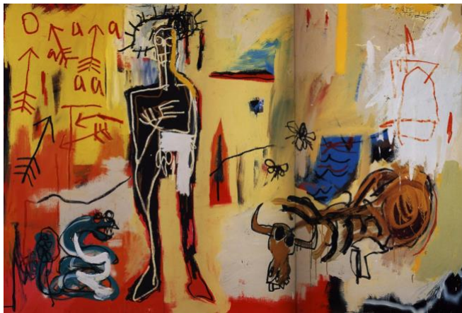
Acque pericolose (poison oasis) , Jean-Michel Basquiat, 1981