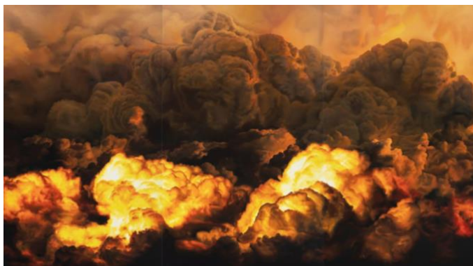
Untitled , Oil on printed canvas - Anne Imhof, 2022, Paris, Pinault Collection